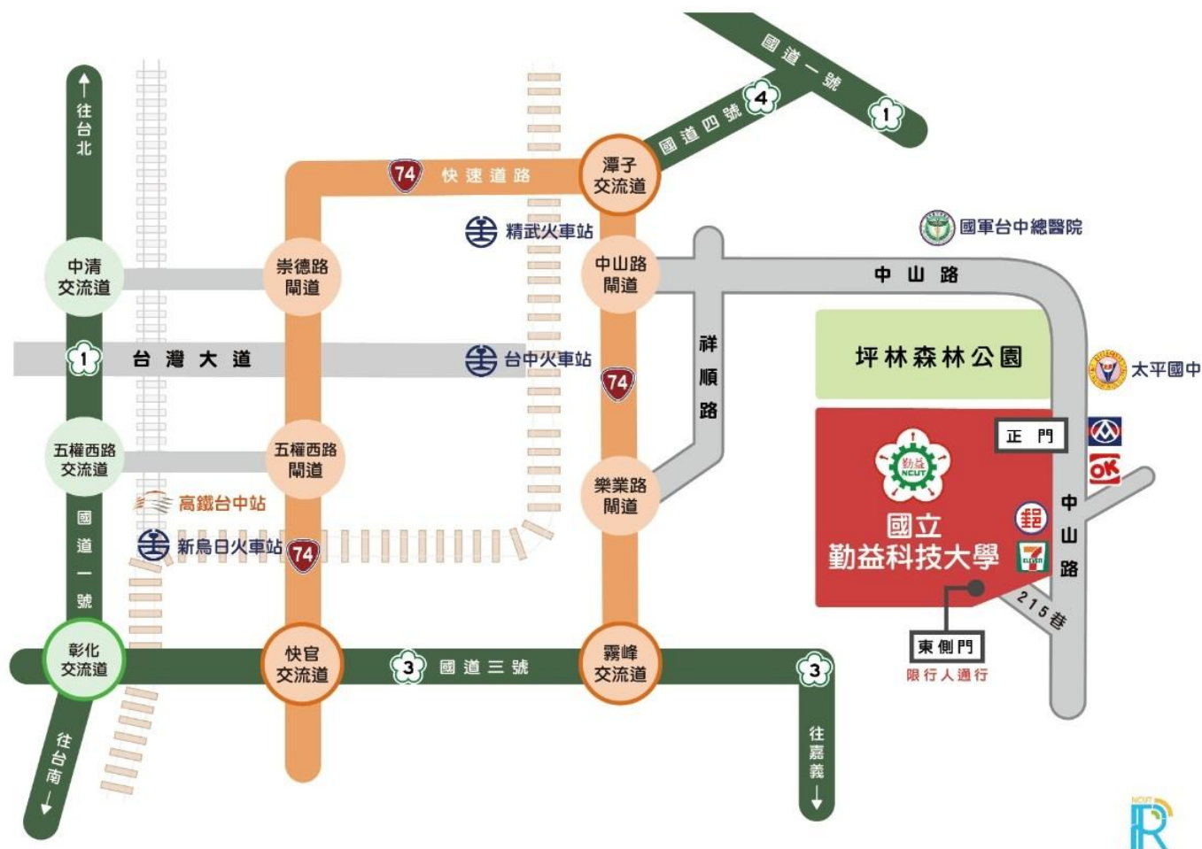
圖 1 交通路線圖(汽車)