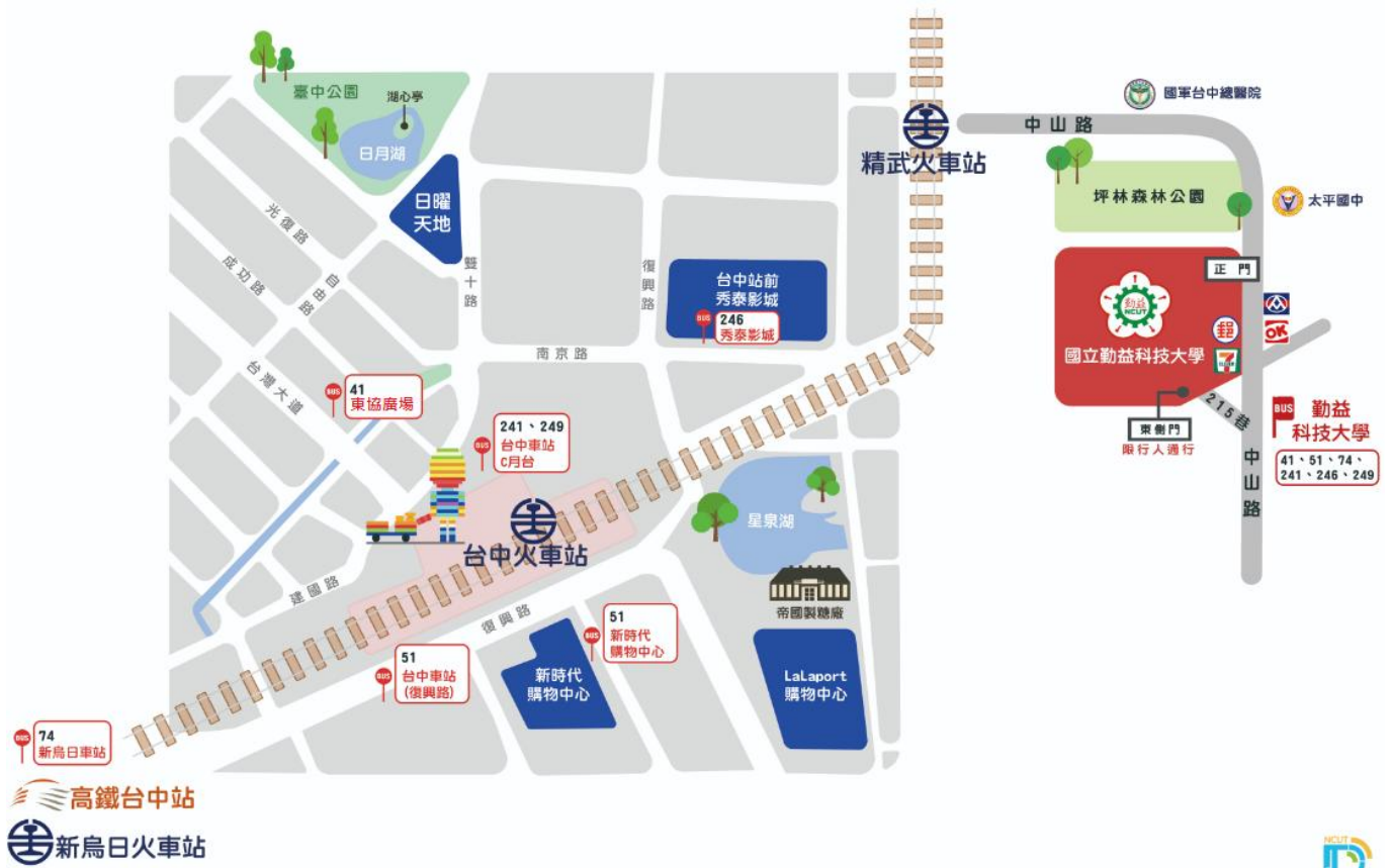
圖 2 交通路線圖(大眾運輸)